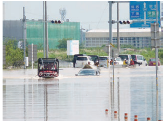
常総市における水陸両用バギーを使用した救助活動

は、消防庁の体制を消防庁長官を長とする「消防庁災害対策本部（第3次応急体制）」に改組した。