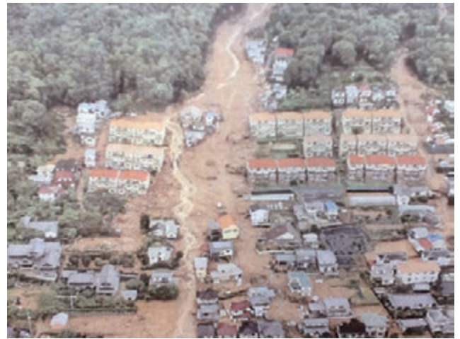
広島市安佐南区上空からの被害状況

消防庁では、8月20日4時30分に応急対策室長を長とする「消防庁災害対策室(第1次応急体制)」を設置し情報収集体制の強化を図るとともに、甚大な被害状況から、8時30分には国民保護・防災部長を長とする「消防庁災害対策本部(第2次応急体制)」に改組した。さらに、8月22日9時00分には、災害対策基本法第24条第1項に基づき、政府に「平成26年(2014年)8月豪雨非常災害対策本部」が設置されたことを受け、消防庁の体制を消防庁長官を長とする「消防庁災害対策本部(第3次応急体制)」に改組した。