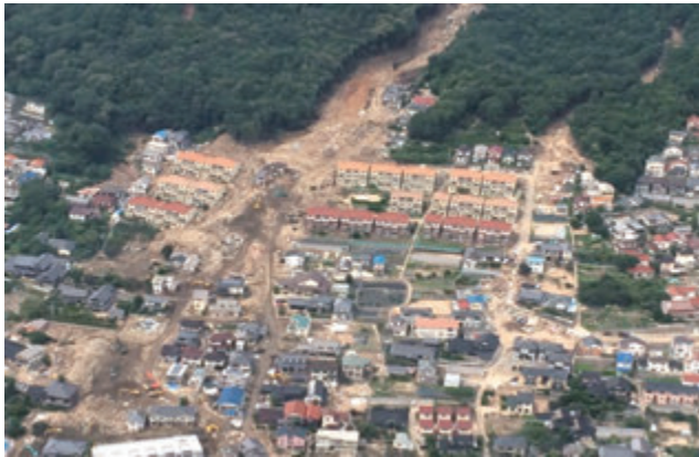
平成26年広島県広島市の土砂災害の被災現場