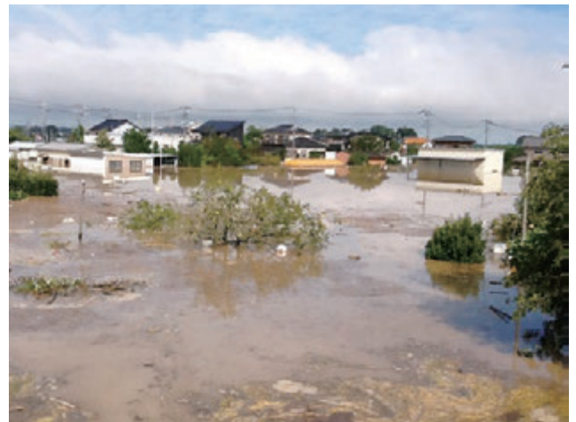
常総市における被害状況