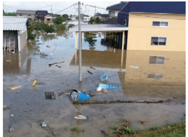
平成27年9月関東・東北豪雨 茨城県常総市の被災現場