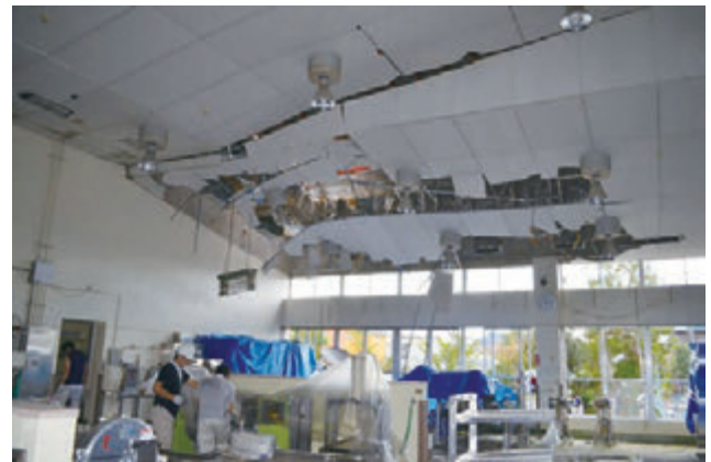
平成25年9月2日の埼玉県越谷市の竜巻被害

また、平成25年においても、埼玉県越谷市等で竜巻等突風により大きな被害が発生したことにかんがみ、竜巻等突風対策局長級会議が開催され、予測情報の改善、災害情報等の伝達のあり方、防災教育の充実、建造物の被害軽減策（窓ガラス対策等）のあり方、被災者支援のあり方について報告が取りまとめられた。消防庁及び気象庁では、平成25年4月より栃木県及び茨城県、平成26年4月より関東地方一円において、消防本部に寄せられる竜巻等突風の発生に関する通報の内容を気象台に情報提供する試行的な取組を実施している。