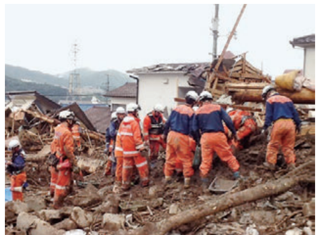
広島市土砂崩れ現場における活動